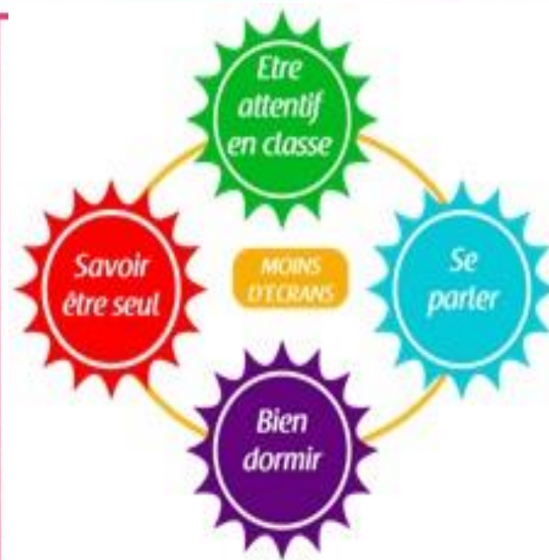
Tableau II: LES 4 PAS de Sabine Duflo d'après [19].